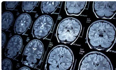
Chụp MRI não - Quy trình thực hiện kỹ thuật chụp MRI